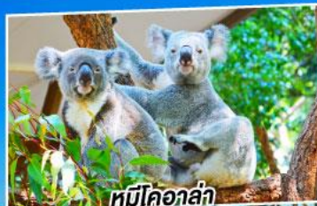
หมีโคอาล่า