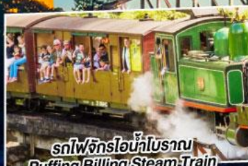
รถไฟจักรไอน้ำโบราณ Puffing Billing Steam Train