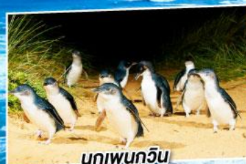
นกเพนกวิน